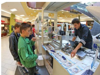
Noč raziskovalcev v Celju