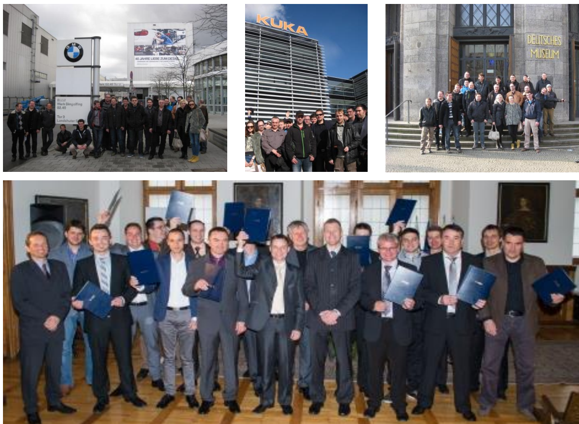
Slika 3: Utrinki iz izvajanja izobraževanih dejavnosti in strokovnih ekskurzij.