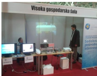
Sejem Terotech-Vzdrževanje v Celju

S prispevki je šola sodelovala na mednarodni znanstveni konferenci ICIT&MPT 2014 ter s prispevkom tudi na dogodku IRT forum 3000 v Portorožu. V mesecu maju 2014 je s tremi dogodki sodelovala na Tednu vseživljenjskega učenja ter se z lastnim razstavnim prostorom udeležila dogodka Noč raziskovalcev v Celju (september 2014).