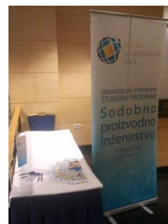
IRT forum v Portorožu