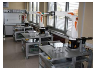
Slika 2: Prostori, v katerih se izvaja pedagoški proces.

Najpomembnejša raziskovalna oprema, s katero razpolaga Visoka šola za proizvodno inženirstvo, je predstavljena v naslednji preglednici.