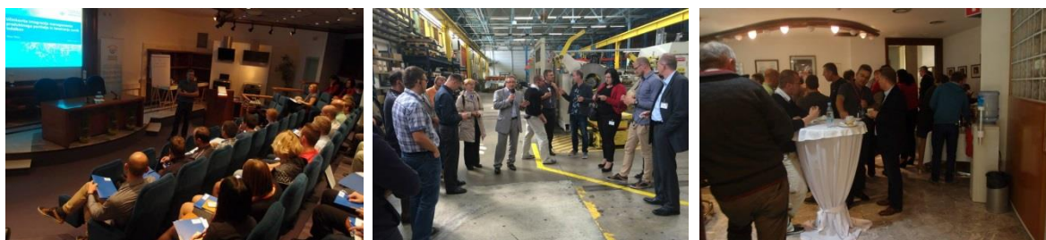
Slika 5: Utripi iz izobraževanja »Učinkovita integracija managementa produktnega portfelja in lansiranja novih izdelkov«.

Delavnico smo izvedli v prostorih podjetja Gorenje d.d. v Velenju, kjer so nam omogočili tudi ogled njihove proizvodnje gospodinjstskih aparatov.