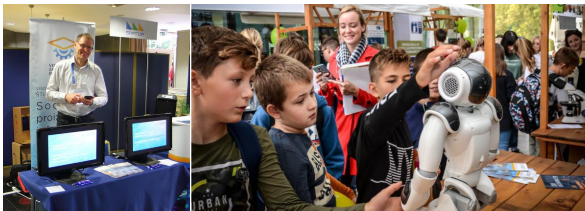
Dan raziskovalcev v Celju