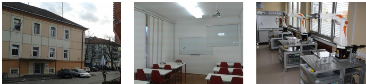
Slika 3: Prostori, v katerih se izvaja pedagoški proces.

Najpomembnejša raziskovalna oprema, s katero razpolaga Visoka šola za proizvodno inženirstvo, je predstavljena v naslednji preglednici.