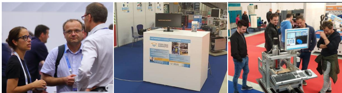
IRT forum v Portorožu