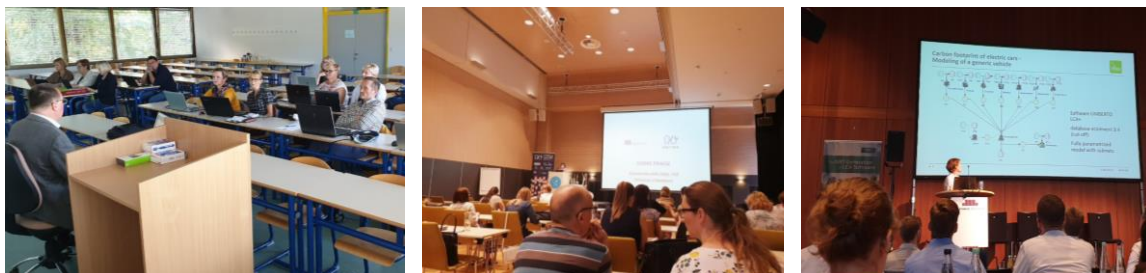
Slika 2: Utrinki iz izobraževanj za sodelavce VŠPI.